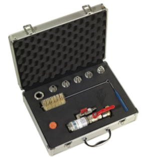
Feinspritzlanze im Koffer mit 5 Düsen und Werkzeug

Fine spray lance in box with 5 nozzles and cleaning tools