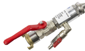
Feinspritzlanze mit 1 Düse

Material hose 40 bar Available lengths S.159