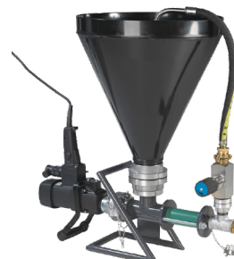
Anbausatz Drosselventil kpl.