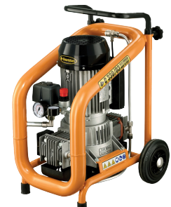
Kompressor C330/03 ölfrei