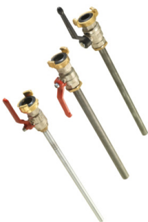
Verfüllrohr mit Kugelhahn D 12 - D 20 mm

Filling tube with ball tap Dia 12 - Dia 20 mm