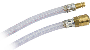
Luftschlauch mit Schnellkupplung