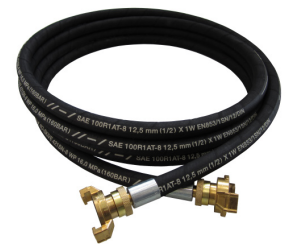
Materialschlauch 40 bar Verfügbare Längen S. 309

Material hose 40 bar Available lengths S.309