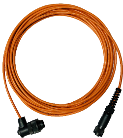
Fernsteuernkabel mit Ein- / Aus- Schalter