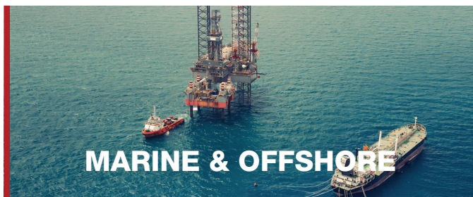
MARINE & OFFSHORE