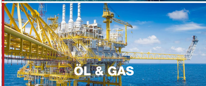
ÖL & GAS