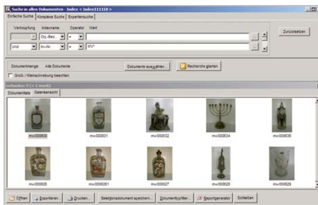
Trefferanzeige als Galerieansicht Jetzt auch als Ausdruck verfügbar!